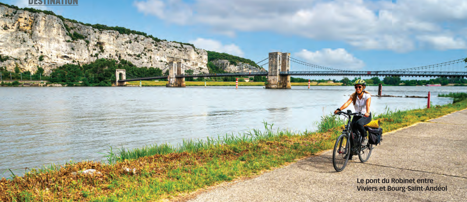
Le pont du Robinet entre Viviers et Bourg-Saint-Andéol