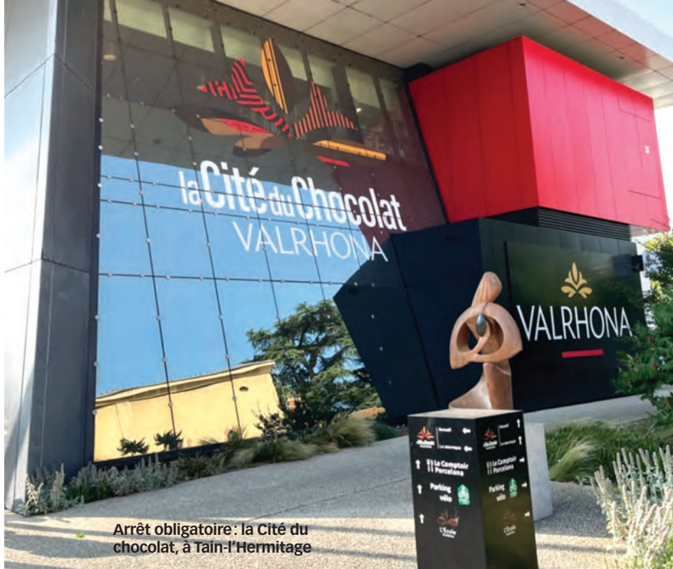
Arrêt obligatoire: la Cité du chocolat, à Tain-l'Hermitage

blématique où la confiserie est cuite au chaudron avec ses amandes caramélisées. Puis nous roulerons de pont en pont vers Châteauneuf-du-Rhône, vers son barrage et son écluse, mais surtout son cœur médiéval, avant que Viviers ne nous dévoile ses hôtels particuliers et son pont romain.