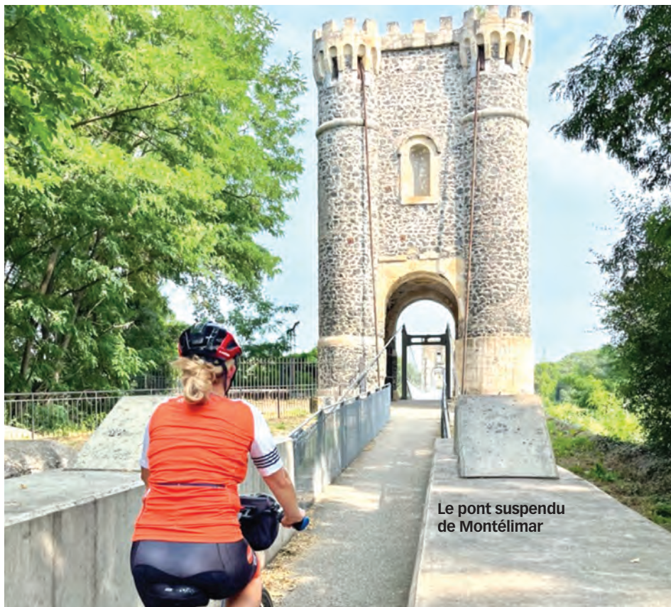
Le pont suspendu de Montélimar

du pour terminer en beauté en dégustant des purées d'olives, parfumées au moulin Lou Mouli d'Oli. Il faut aussi garder une petite soif afin de déguster les vins de l'Ardèche au domaine Les Amoureuses. Tout près, le vigneron musicien Raphaël Pommier du Domaine de Cousignac encourage la pousse de ses raisins avec une douce musique. Il est temps d'abandonner nos beaux vélos Gitane, appelés à repartir vers d'autres aventures sur la ViaRhôna. ●